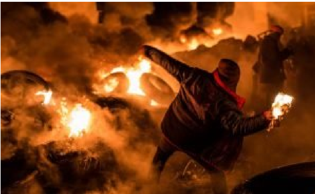
La rivolta di