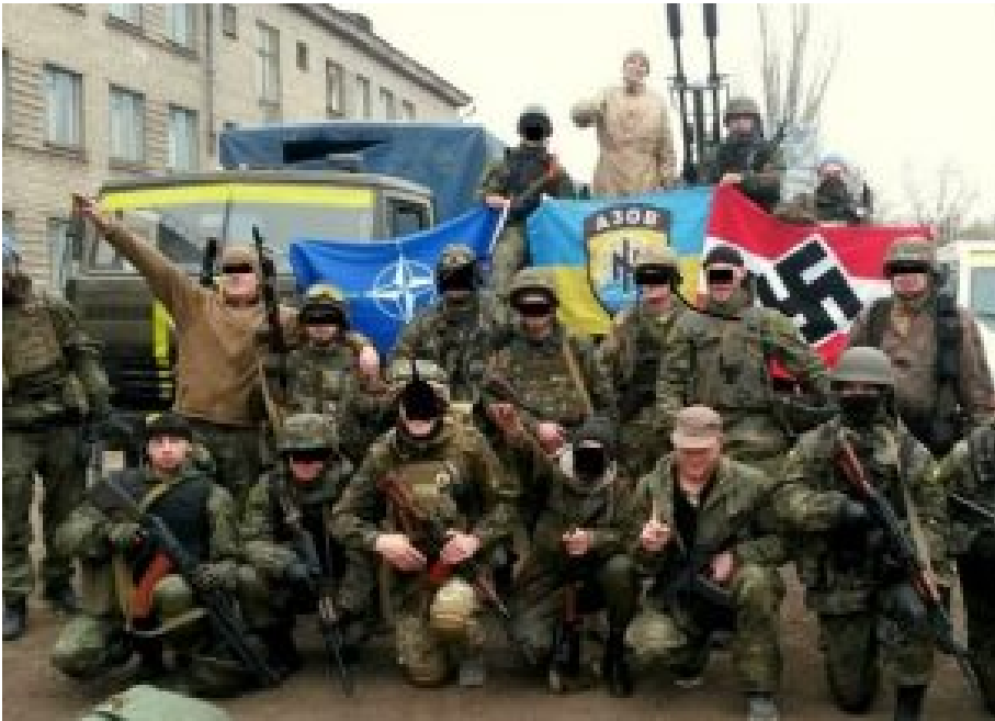
Il battaglione Azov

S: I sondaggi ancora oggi gli danno il 70% di consensi. E volendo anche essere scettici su quella cifra, di certo oltre la metà dei russi è con lui. Ma la cosa più importante in questo senso è che anche i russi che non condividono la decisione di Putin di fare la guerra, in ogni caso considerano la NATO e gli Stati Uniti una minaccia per il loro paese. Il gradimento per l'occidente non è affatto così diffuso in Russia come spesso la vostra stampa vuol far credere.