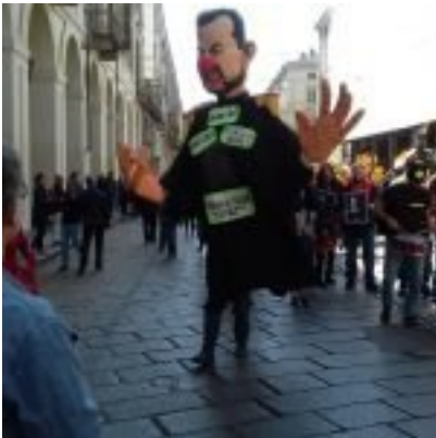
Torino, Corteo 1° maggio