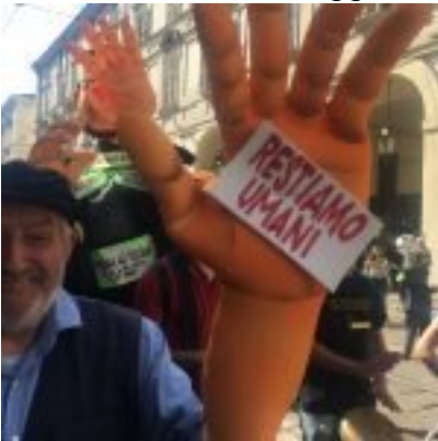
Torino, Corteo 1° maggio