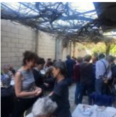
Pranzo in via Trivero