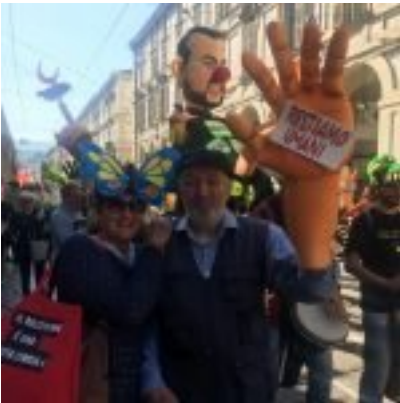
Torino, Corteo 1° maggio