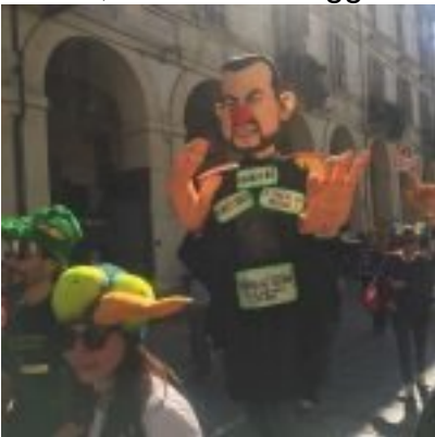
Torino, Corteo 1° maggio