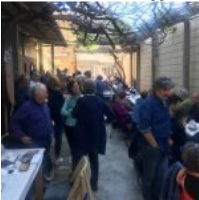
Pranzo in via Trivero