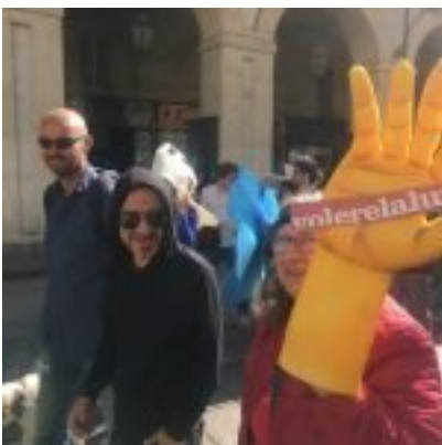
Torino, Corteo 1° maggio

Di seguito, per chi non c'era, una piccola documentazione fotografica della giornata