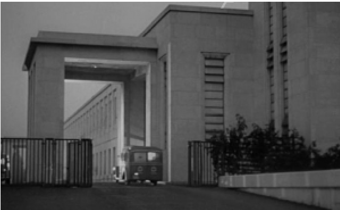
L'ospedale Niguarda nel 1951

Poi l'occhio artisticamente colto di Lattuada dà al film una spiccata preziosità formale, sfruttando le allora modernissime architetture razionaliste dell'ospedale Niguarda, inaugurato nel 1939, che vengono riprese enfatizzandone la stilizzazione fino a giungere quasi all'astrattezza metafisica, come in un quadro di De Chirico (e ricordiamo che Lattuada aveva scritto come critico d'arte sulla rivista Corrente , di cui fu anche co-